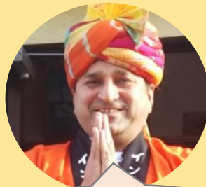
日本のカレーも おいしいね