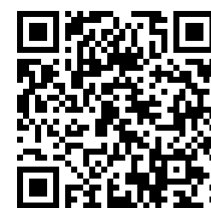
横瀬町ハザードマップ

また、今後は台風等の被害が起きやすい季節になりますので「横瀬町ハザードマップ」を改めて確認し、災害時の各家庭の行動(マイ・タイムライン)についてもご家族で話し合ってみてください。